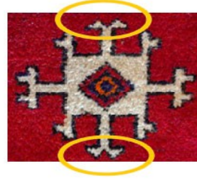
Lapikê Spî Balîfê