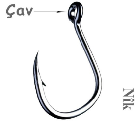
figür 7: nîk (olta / kanca) & çavê nîkê (kanca gözü)

Son olarak, Nîk teriminin ilkel balıkçılıkta kullanılan kanca (bkz figür 7) içinde kullanıldığı, yukarıdaki motif incelenmesinde daha belirgin hale gelmektedir. Ayrıca, halı veya yastık dokumalarda, göl ve kanca motiflerin aynı desende beraber bulunmaları, eski bir yaşam tarzının yansımasına işarettir. Dolayısıyla, ileri ki araştırmalarda farklı halılarda alınan motifler üzerinde yapılacak çalışmalarda, bu gibi detaylarında ele alınması ve izah getirilmesi gerekmektedir.