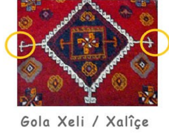
Gola Xeli / Xalîçe