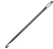
figür 1: NİK (tığ).

Kürdler'de tevn halı dokuma sanatı oldukça eski bir gelenektir. Bu yüzden kullanılan terimlerin, orijin olma ihtimali oldukça yüksektir. Bu gelenek, teknoloji, kültür erozyonu, modernleşme ve hatta müdahalelere uzak olduğu için de, Kürd kültürünün önemli miraslarından birisidir. Bu sanat ile ilgili kullanılan terimlerin çoğu şimdilerde günlük hayatta kullanılmamaktadır. Tevn temaları yüzyıllara dayanır ( dünyanın en eski halısı Pazyryk M.Ö. 3. - 4. yüzyıla ait ), bu süreç içinde farklı akımların etkisi altına girmiş ve o dönemlerin özelliklerini de içinde alarak günümüze kadar gelebilmiş bir sanattır. Dolayısıyla, bu gibi konuların derinlemesi incelenmesi ve her terimin özel olarak tek tek ele alınması, Kürdlerin gizemli tarihi hakkında bir çok ipuçtu verecektir.