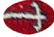
NĪka Golê Xeli / Xalîçe